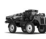
VERSATILE SX 275