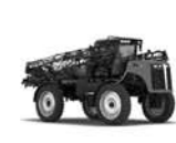
VERSATILE SX 275