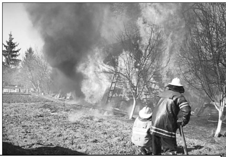
Огонь на своем пути не щадит ничего: ни творения человеческих рук, ни природные объекты...