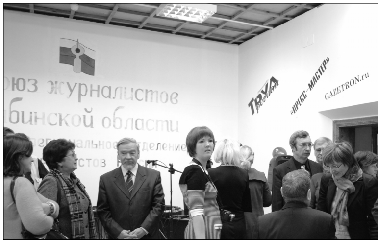
Так выглядит конференц-зал Дома журналистов Челябинской области