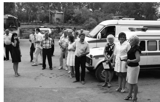
Один из районных семинаров в 2010 году принимали еманжелинцы.

Волнует селян и общественная безопасность. В праздничные дни, выходные, особенно в вечернее время, на дискотеках «гуляет» молодежь. Поэтому не зря возникает вопрос о проведении таких мероприятий участковыми. Но, по словам начальника службы уполномоченных участковых милиции А.Н. Чередника, проблема с участковыми актуальна для большинства населенных пунктов района. В данный момент участковой Еманжелинского сельского поселения на-