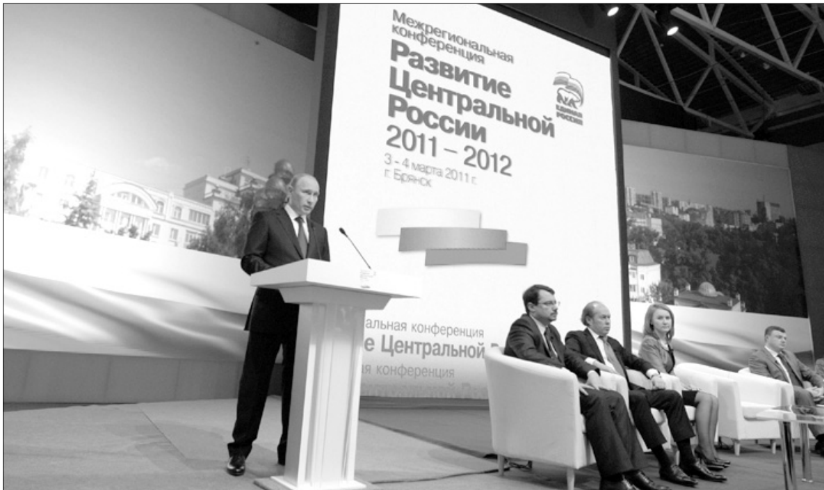
Владимир Путин: «Главное – сохранить доверие людей. Наши предки строили великое государство и добились успеха. От всех нас сегодня зависит, каким это государство будет в будущем».

Председатель партии «Единая Россия» премьер-министр РФ Владимир Путин 4 марта посетил Брянск с рабочей поездкой, где принял участие в межрегиональной конференции партии «Единая Россия». Основной темой встречи стало обсуждение стратегии развития Центральной России до 2020 года, благодаря которой продолжится стимулирование промышленности, экономики и социальной сферы.