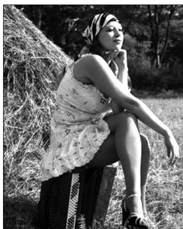
Фото: портрет неизвестной сельянки

Добавим, что поселение Кочкарское Пластовского района имеет свою