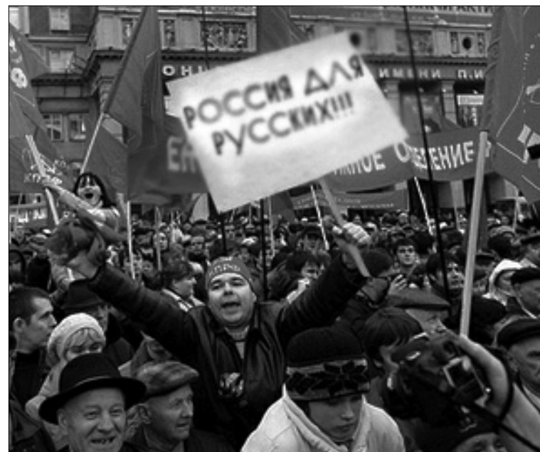
На фото видно, как в ряды коммунистов вливаются националисты

Эксперты считают, что коммунисты вошли в полосу конфликтов, и внутри КПРФ наметился явный раскол. Есть московская организация, которая открыто выступает против лидера КПРФ Зюганова, есть челябинская. Было единство в стане коммунистом уже нет, и этот раскол будет только обостряться.