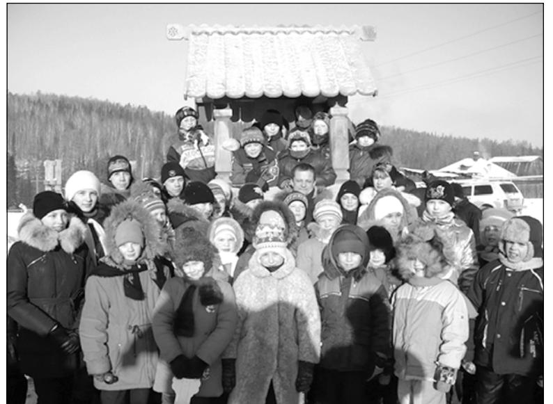
▲ Успели на горках покататься

— Если до сих пор мы открывали по одному городку в месяц, то с апреля — минимум по два, — продолжает Сергей Анатольевич. — В мае они будут установлены в населённых пунк-